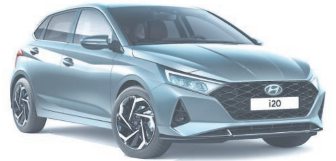
Fahrzeugabbildung zeigt aufpreispflichtige Sonderausstattung / Tageszulassung.