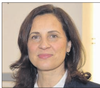
Samiah El Samadoni

zung, mit der Hilfe zum Lebensunterhalt, dem Wohngeld oder auch mit Leistungen der Krankenkassen oder Schwierigkeiten beim Kindergeld – die Bürgerbeauftragte für soziale Angelegenheiten des Landes Schleswig-Holstein, Samiah El Samadoni, hilft bei allen Fragen rund um das Sozialrecht. Darüber hinaus berät die Bürgerbeauftragte auch als Leiterin der Antidiskriminierungsstelle des Landes und als Ombudsperson in der Kinder- und Jugendhilfe im Rahmen dieser Sprechstunde. Zudem ist die Bürgerbeauftragte auch