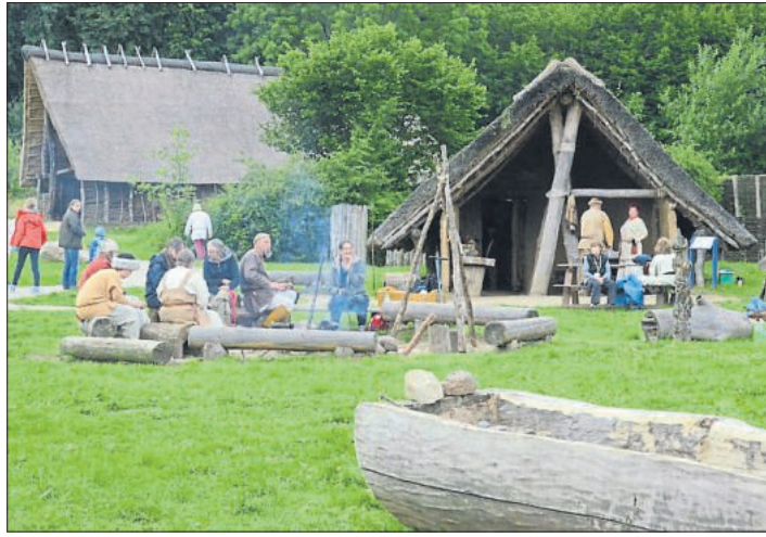
Wieder viel Leben im Steinzeitdorf.

Während der Öffnungszeiten des Parks (Di. bis So. jeweils von 11 bis 17 Uhr) werden dann unter dem Motto „In die Steinzeit eintauchen - Zwei Wochen leben wie in der Steinzeit“ im archäologischen Freilichtmuseum Experimente zur steinzeitlichen Archäologie durchgeführt. Erwartet werden dazu knapp 50 Archäologinnen und Archäologen, Archäotechnikerinnen und Archäotechniker sowie Muse-